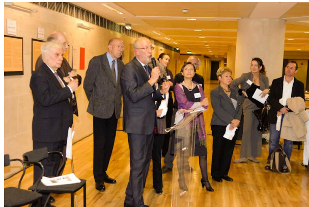
La conférence du G8 Patrimoine et les remises de prix