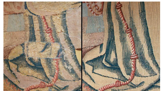
Restauration d'une tapisserie avant et après