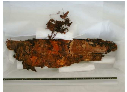
Etape de restauration des tissus de Mongolie

Plus d'info sur : www.chevalier-conservation.com