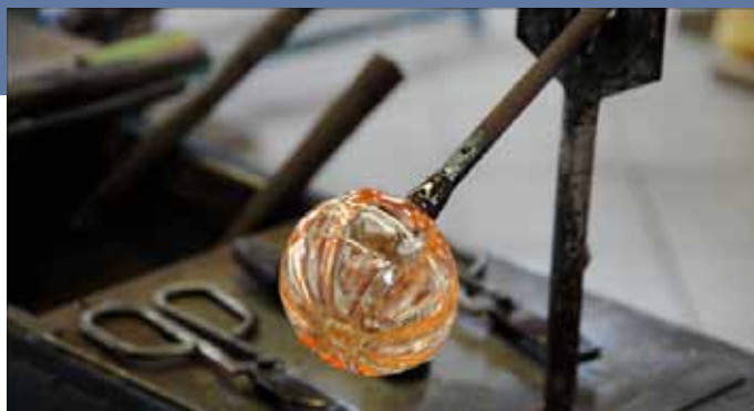
Verrerie des Lumières

Carrousel du Louvre du 7 au 10 novembre 2013