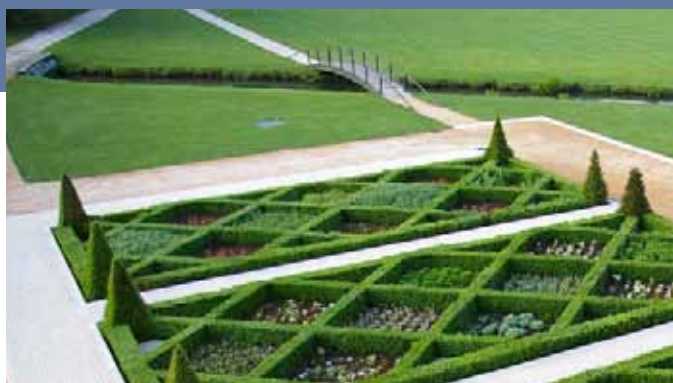
Art Topia

Carrousel du Louvre du 7 au 10 novembre 2013