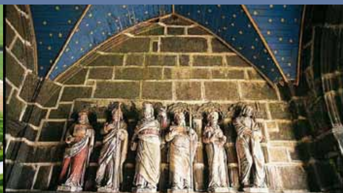
Le Faou