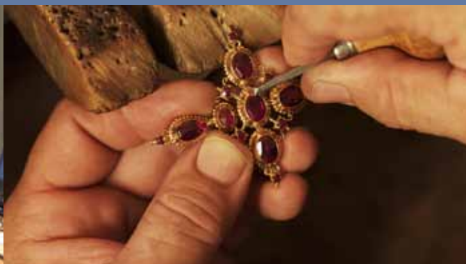
Confrérie du Grenat de Perpignan