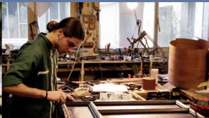
Bazile © M Gauchet