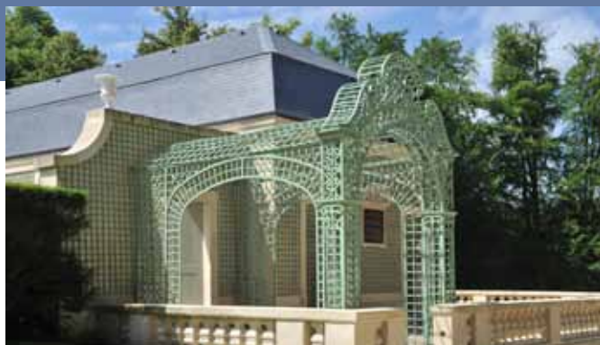
Tricotel © DR

Carrousel du Louvre du 7 au 10 novembre 2013