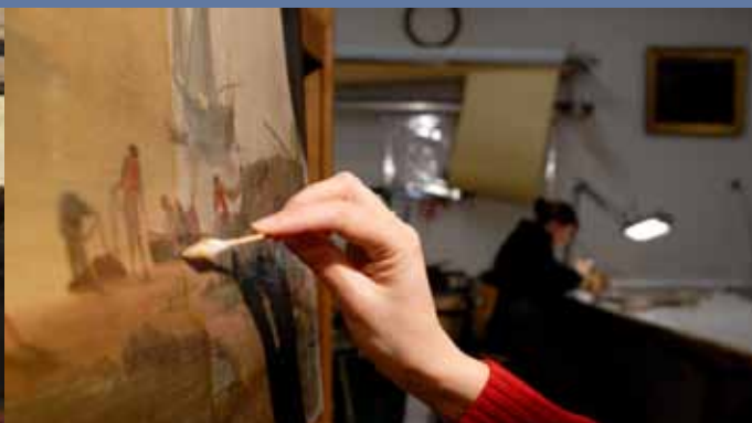
Polnek © M. Gauchet