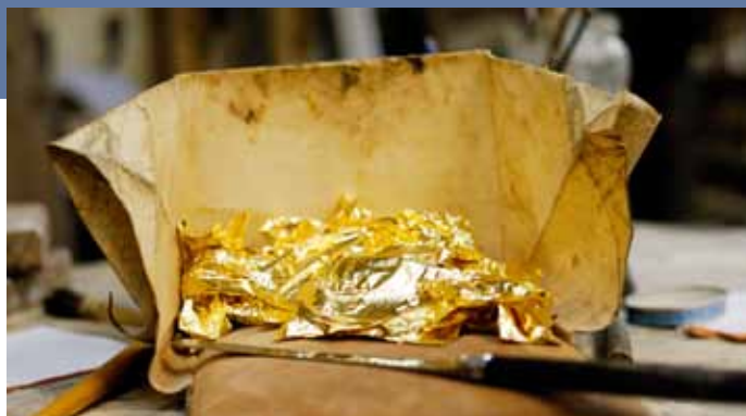
L'or en décor