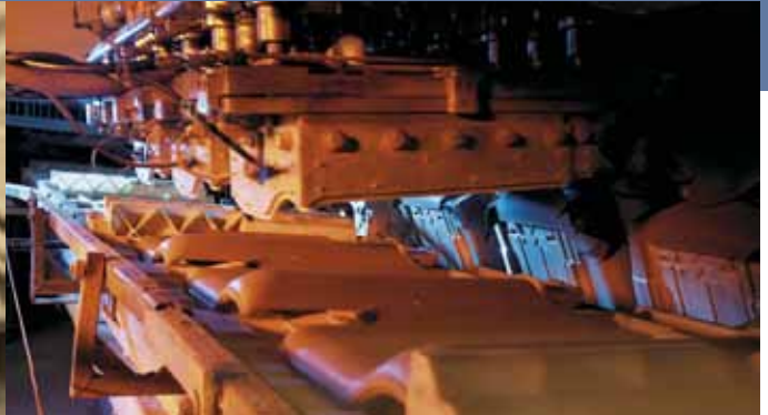
Wienerberger