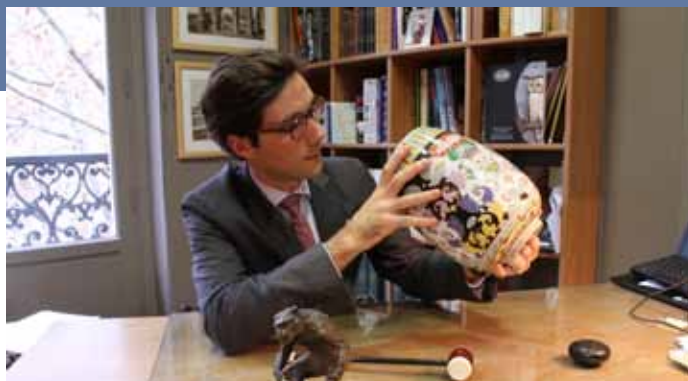
Audap & Mirabaud

Carrousel du Louvre du 7 au 10 novembre 2013