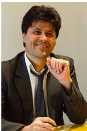
Serge Nicole © Boigontier

Lorsqu'Ateliers d'Art de France a pris la décision de prendre en main le devenir du Salon International du Patrimoine Culturel, nous avons l'ambition d'en faire le "leader" mondial du secteur.