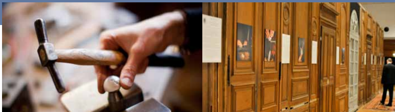
Laurence Oppermann © G.Leimdorfer

Carrousel du Louvre du 7 au 10 novembre 2013