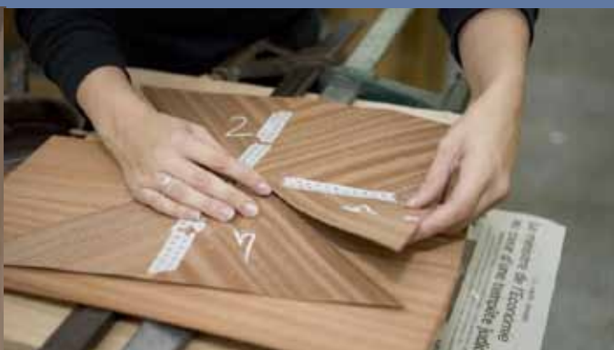
CFA La Bonne graine