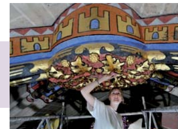
Nettoyage des voûtes Cathédrale de Chartres