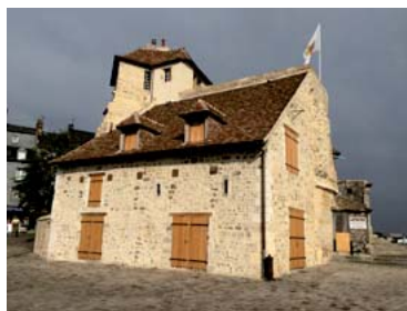
Lieutenance - Honfleur

Techniques d'expression, communication et management, outils informatiques (AutoCAD), certification et qualité, langue appliquée (anglais).