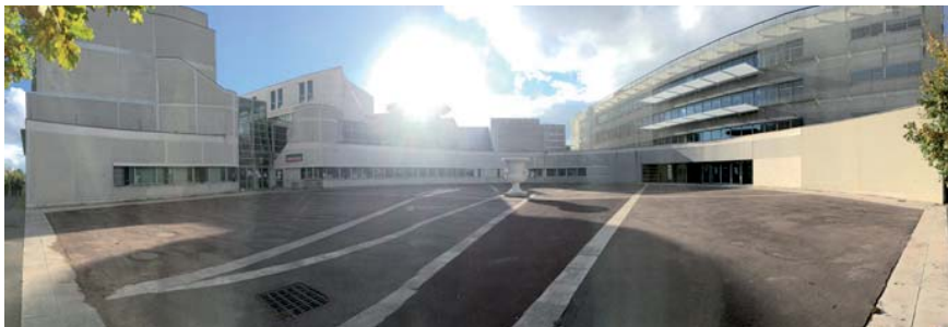
Université de Cergy-Pontoise - site de Neuville-sur-Oise