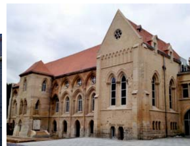
Palais Ducal - Caen