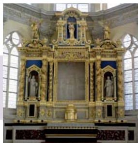
Maître Autel - Rouen Chapelle du lycée Corneille