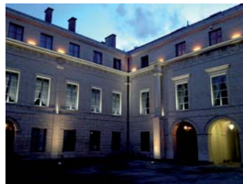
Préfecture du Calvados