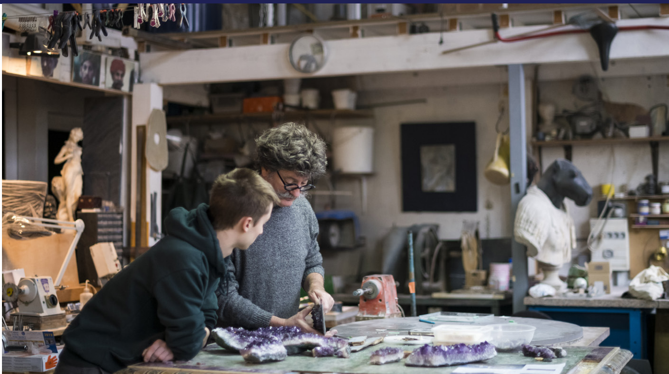
ATELIER HERVE OBIUGI