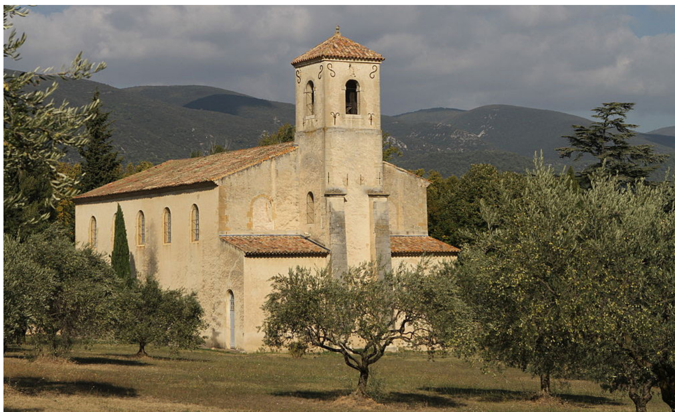
TEMPLE DE JOURMARIN